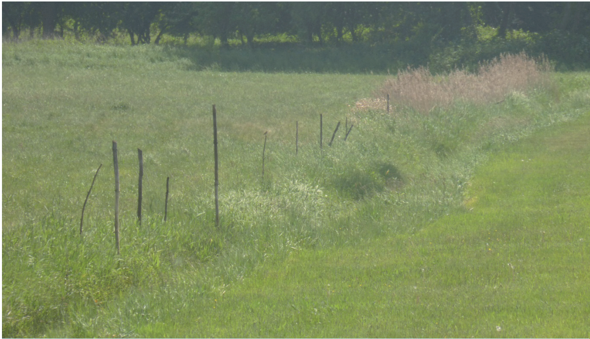
Abb. 3: Softzaun an einem Entwässerungsgraben. - Post row along a ditch.

K ernstück des vom BfN geförderten Wiesenvogelschutzprojektes 2015-2018 am Grünen Band bei Salzwedel war ein intensives Management der landwirtschaftlichen Arbeiten auf vom Braunkehlchen und anderen wertgebenden Arten brutbesiedelten Flächen. Hierbei erfolgte eine an das Fortpflanzungsgeschehen angepas-