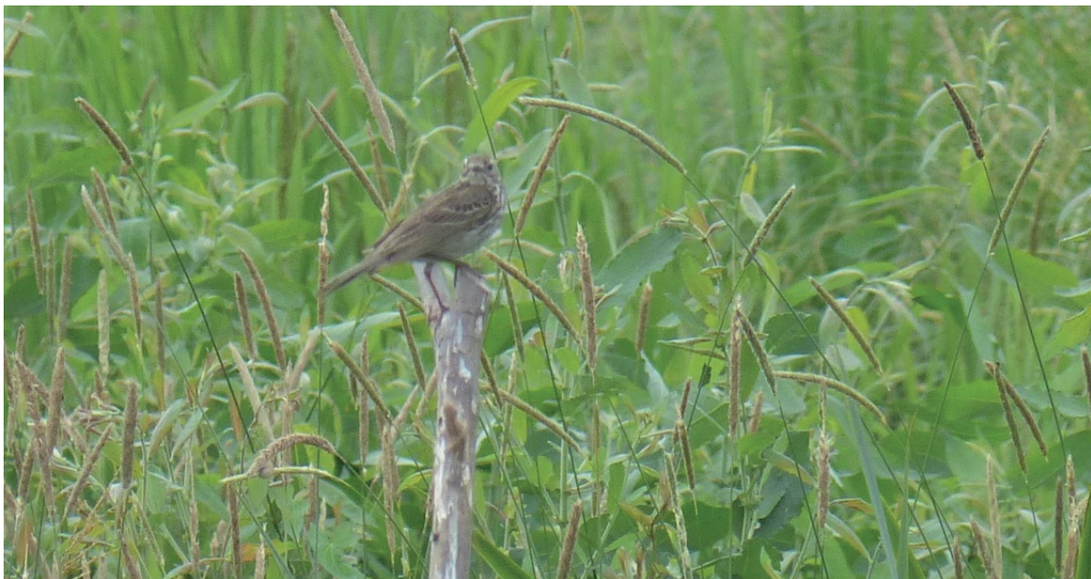
Abb. 2: Wiesenpieper auf einem Sticken. - Meadow Pipit on a stake.

wie im Vorjahr aus, wobei sich die Tendenz zur Annahme der Holzsticken durch Braunkehlchen und Wiesenpieper leicht verbessert hat. Beim Braunkehlchen fällt die günstigste Auswirkung der Anlagen in die Zeit des Durchzuges und der Revierbesetzung Anfang bis Mitte Mai. Hier werden augenscheinlich viele Vögel in eine ansonsten weitgehend wartenfreie Umgebung gelockt. Mit dem verstärkten Pflanzenaufwuchs ab Mitte Mai stehen dann aber auch andernorts Sing- und Jagdwarten in steigender Anzahl zur Verfügung (zumindest auf nicht beernteten Standorten), was offensichtlich auch zu einer verstärkten Umsiedlung der Braunkehlchen führt. Der ursprünglich vorhandene Reiz der Zäune nimmt von da an ab. Die Wirksamkeit der Anlagen auf die Ansiedlungsbereitschaft des Braunkehlchens hängt generell vom Vorhandensein schon in den Revieren bestehender Ansitzplätze ab, d.h. je wartenfreier das Gelände, umso höher ist der von den Sticken ausgehende Reiz auf das Braunkehlchen. Die Wirksamkeit stellt sich also in folgender Reihenfolge dar: wartenfreies Grünland > mit Warten bestandenes Grünland > Standorte in weniger als 25m Abstand zu Großgehölzen (Baumhecken, Wäldchen). Weiterhin ist zu beachten, dass Anlagen an mäßig befahrenen Feldwegen schlechter angenommen werden als solche an kaum befahrenen Wegen. An Straßen wurden die Anlagen gar nicht angenommen.