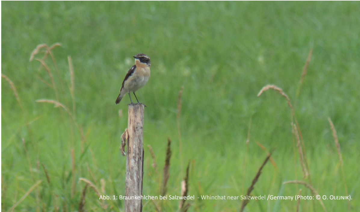
Abb. 1: Braunkehlchen bei Salzwedel - Whinchat near Salzwedel /Germany.

OLAF OLEJNIK (BUND Sachsen-Anhalt, Koordinierungsstelle Grünes Band, Salzwedel, Germany)